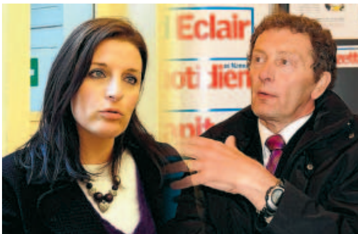
Le couple œuvre depuis 21 ans pour le peuple népalais. ■ E.D.

Le couple a également créé un système de parrainage qui permet à des citoyens belges d'envoyer une aide financière aux habitants de petits villages défavorisés. "Au début je n'avais