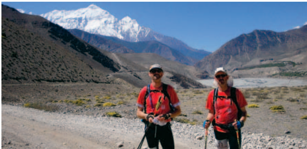
Les deux coureurs humanitaires à quelques foulées (!) du toit du monde. ■ DR

E.B.: Je suis sûr que l'on se fixera un nouveau défi. C'est la vie après tout. Mais je ne conçois plus une course à l'étranger s'il n'y a pas un objectif humanitaire. Cela ne sert à rien de courir pour soi uniquement. C'est tellement gratifiant de venir en aide à une population défavorisée. «